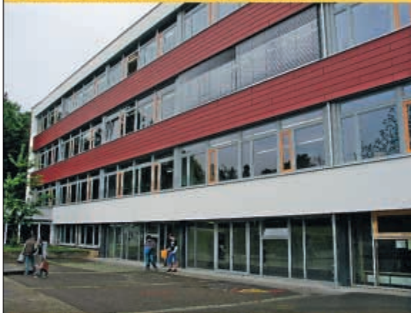
Fassadensanierung Grundschule: Diese wurde vorrangig unter energetischen Gesichtspunkten durchgeführt. Kosten: 761.000 €.