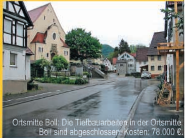
Ortsmitte Boll: Die Tiefbauarbeiten in der Ortsmitte Boll sind abgeschlossen. Kosten: 78.000 €.