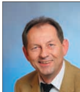
Gotthold Leukhardt Konstrukteur Carl-Baur-Weg 24 1958 Hechingen-Kernstadt