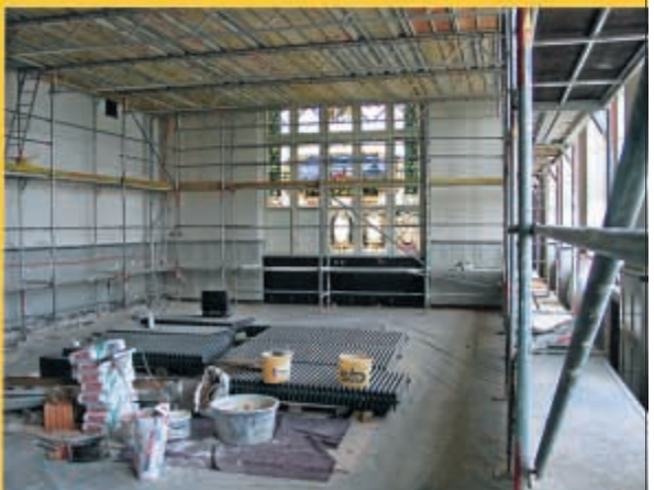
Aula Gymnasium: Zum Festakt "100 Jahre Gymnasium" am 24.7.2009 wird die Aula in neuem Glanz erstrahlen. Kosten: 50.000 €.