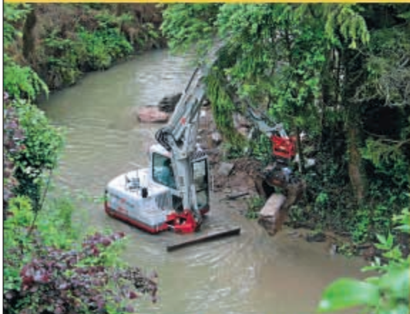
Hochwassermaßnahmen Starzel: Unter erschwerten Bedingungen wird in der Unterstadt an Maßnahmen im Bereich der Starzel gearbeitet (Schadensbehebung und Ufersicherung). Dafür sind ca. 15.000 € veranschlagt.