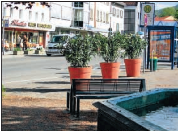
Neue Pflanzkübel werten das Stadtbild auf.