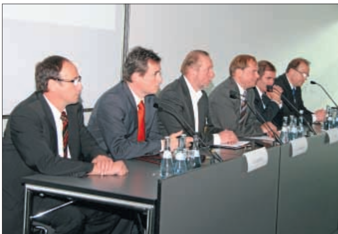
Vertreter der Medizintechnik aus der Region bei einer Pressekonferenz anlässlich der TopClinica