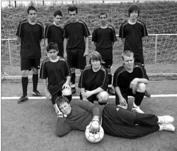
Das Team der Albert-Schweitzer-Schule

Bemerkenswert wäre noch die Fairness und Sportlichkeit in allen ausgetragenen Partien.