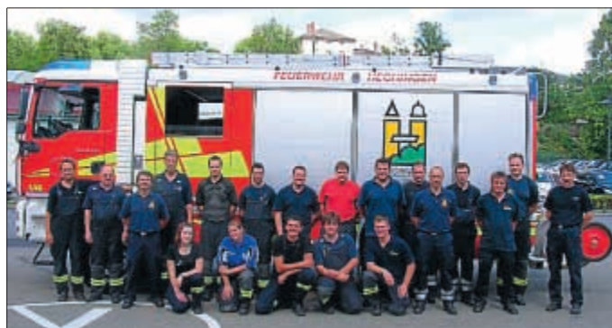
13 Feuerwehrangehörige aus Bisingen, Rangendingen, Jungingen und Hechingen wurden zu Truppführern ausgebildet.

Den Lehrgang absolvierten die Unterrichtenden und die Teilnehmer neben ihren beruflichen Verpflichtungen und den Aufgaben in ihren Feuerwehren.