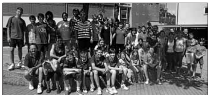
Turnierteilnehmer mit Familien und Freunden