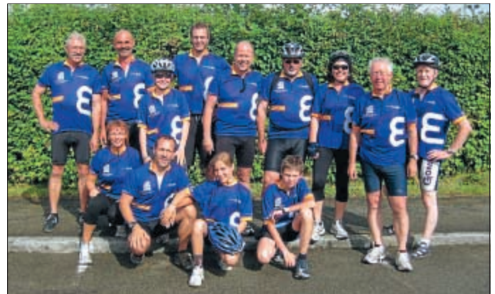
... und die Sonntaggruppe des Hechinger Teams